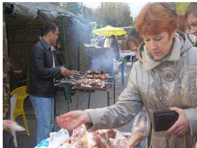
Этот снимок сделан на осенней сельскохозяйственной ярмарке в г. Смоленске, где побывали ярцевчане. Но почему бы нам не замахнуться на столицу?

Эту дилемму решает сейчас для себя каждый ярцевский товаропроизводитель, предприниматель и руководитель крестьянско-фермерского хозяйства